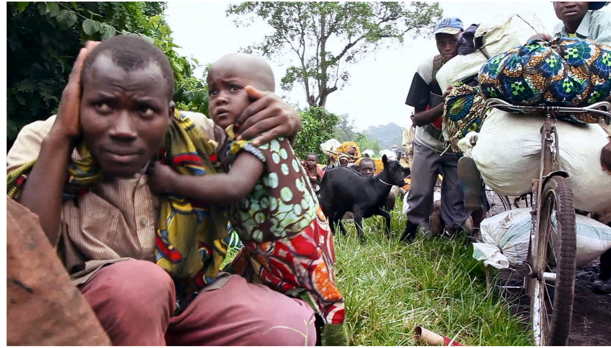
Beeld uit 'L'empire du silence'

Dit discours van dokter Mukwege vormt het uitgangspunt van L’empire du silence . In deze docu, die Michels reeks van elf documentaires afsluit, heeft de Belgische filmmaker het niet langer over de slachtoffers maar over de verantwoordelijken van het leed in Congo. Hij reikt de sleutels aan om deze – helaas nog steeds actuele – tragedie te begrijpen.