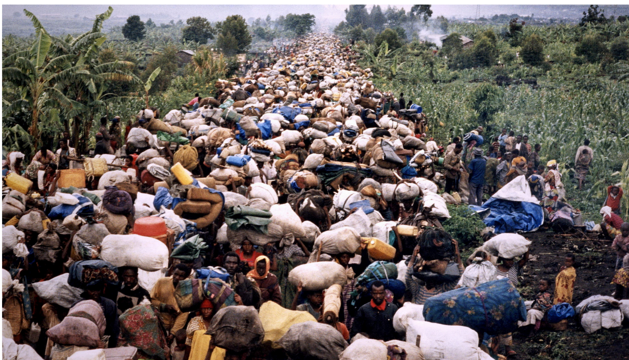
Beeld uit 'L'empire du silence'