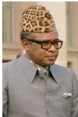
Mobutu Président de la République du Zaïre - 24 novembre 1965 - 16 mai 1997

Cela se passe en République démocratique du Congo, dans ce pays qui s'appelait Zaïre, l'ancienne colonie belge devenue indépendante en 1960, et terrain de jeu des grandes puissances avant que ne s'installe au pouvoir, jusqu'à son départ forcé en 1997, l'homme à la toque léopard, Denis Mobutu .