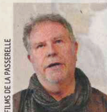
Thierry Michel Cinéaste belge.

"Cette liste confidentielle est une honte absolue, elle permet la protection des bourreaux."