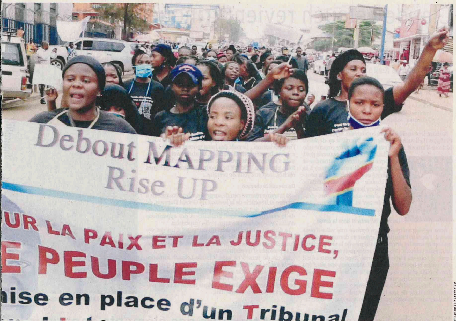
Manifestation pour les dix ans du rapport Mapping afin que les noms des responsables des massacres en République démocratique du Congo (RDC) soient révélés au grand jour.